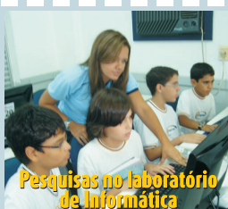
Pesquisas no laboratório de informática