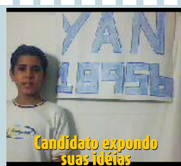
Candidato expõe suas ideias