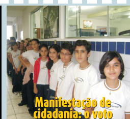
Manifestação de cidadania: o voto