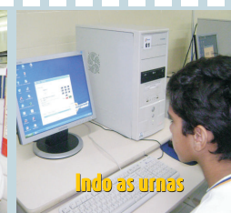
Ido as urnas